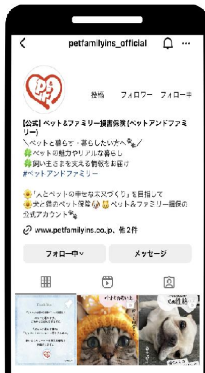
(アカウントイメージ)

これからも、Instagramをはじめ、以下 Web メディアや SNS を通じてみなさまとペットとの暮らしに寄り添った情報をお届けいたしますので、ぜひご覧ください。